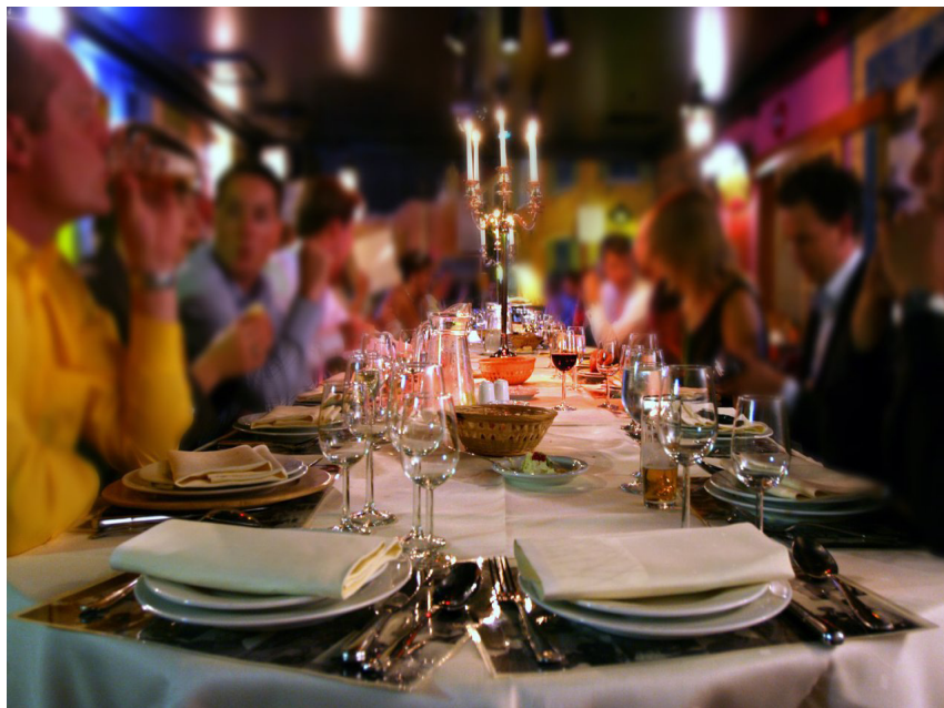
Grillad Trana på lyxkrogar i London